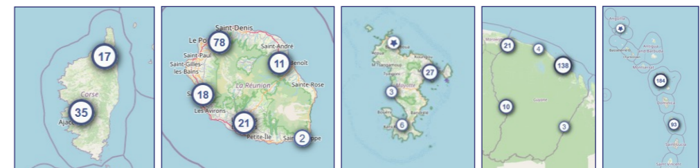
Affichages de la cartographie des partenaires culturels sur ADAGE en zoom large. Les professeurs peuvent centrer la cartographie sur leurs établissements scolaires, 02/08/2022.