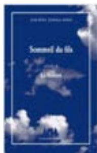
SOMMEIL DU FILS (précédé de) LA MAISON

Également pédagogue, il anime régulièrement des ateliers de théâtre et d'écriture dans différents types de structures (Théâtre du Peuple de Bussang, La Colline – théâtre national, ENS Lyon, ENSATT, Maison du Geste et de l'Image, Théâtre national de Strasbourg – La Traversée de l'été...). Il rencontre FERGESSEN en 2022, au Théâtre du Peuple, dans le cadre du projet « Entre les Etangs » qui les associe pour trois années de création.