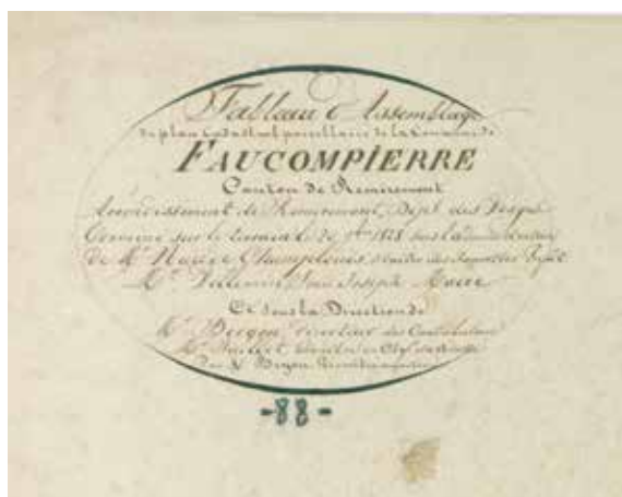
© Arch. dép. Vosges, 3 P 5107/1

D'autres classes ont travaillé sur des ensembles plus grands allant du quartier au village à une période donnée ou sur la durée, abordant ainsi les aspects d'évolutions urbanistiques visibles sur les cartes et plans.