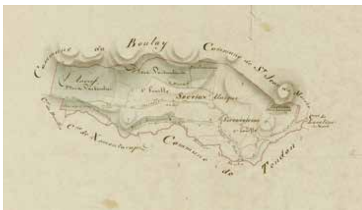
© Arch. dép. Vosges, 3 P 5107/1